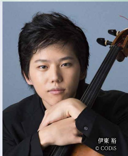
伊東 裕 © CODiS