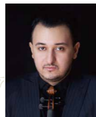
カーライ・エルヌー Ernő Kállai (ヴァイオリン)

2018年、NYカーネギーホールにて、ハンガリー国立歌劇場管弦楽団とF.ヴァッキのヴァイオリン協奏曲を演奏。2016年よりハンガリー国立歌劇場管弦楽団コンサートマスター。Szigeti Quartet(シゲティ弦楽四重奏団)第1ヴァイオリン。