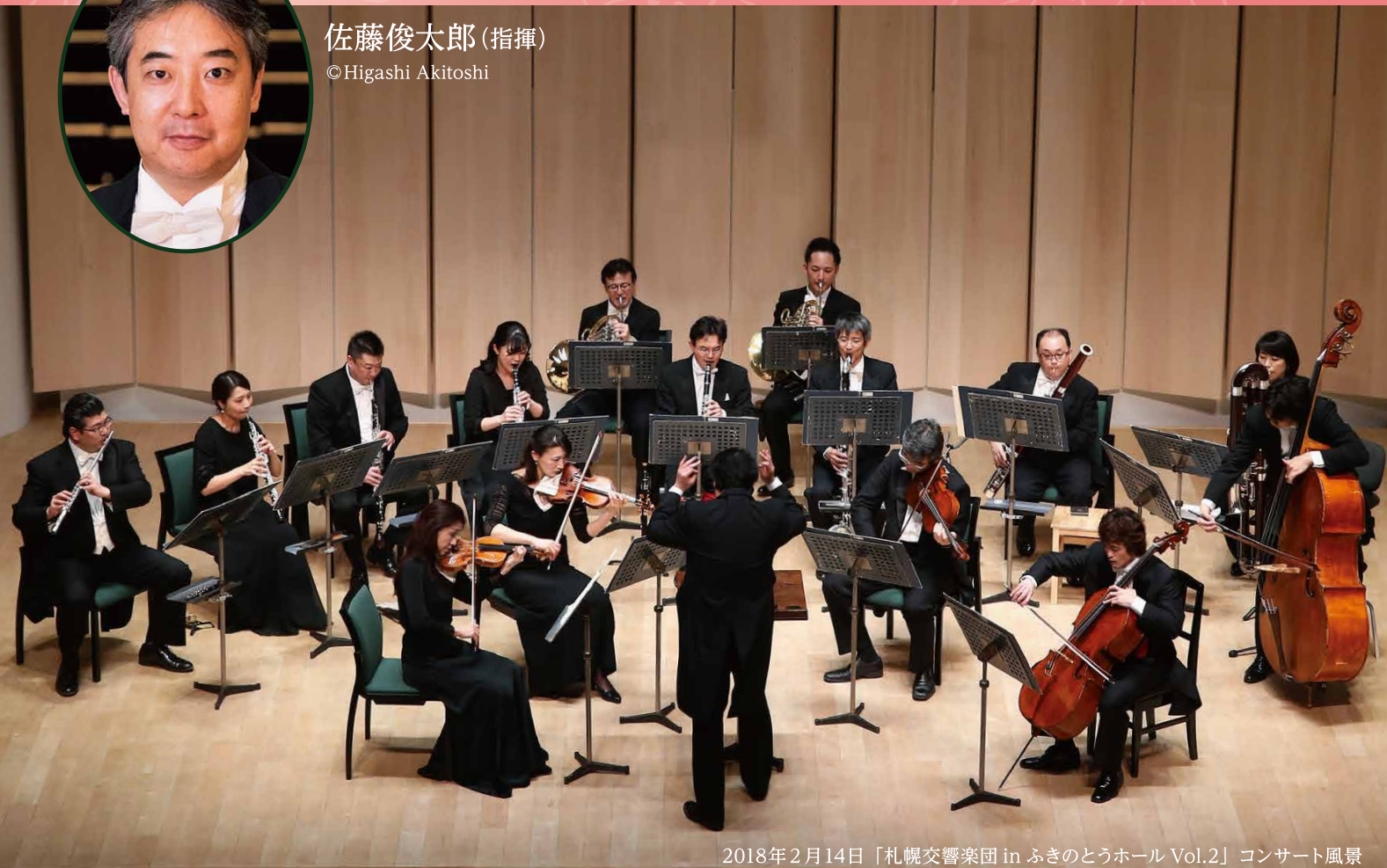
2018年2月14日「札幌交響楽団 in ふきのとうホール Vol.2」コンサート風景