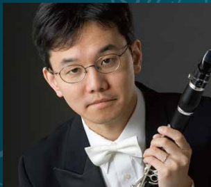
三瓶佳紀 (クラリネット)