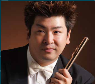
高橋聖純 (フルート)